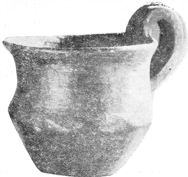
Fig. 3. Cuptoare „Sfogea”. Mormint de incineratie. Cească.

Este foarte importantă această descoperire, atît datorită caracterului ei, clar autohton, cît și, mai ales, a asocierii dintre un tip specific de vas getic și un coif grecesc. El a aparținut unui luptător get important, căci obiectele de proveniență grecească sînt totuși rare în zonă, la această vreme.