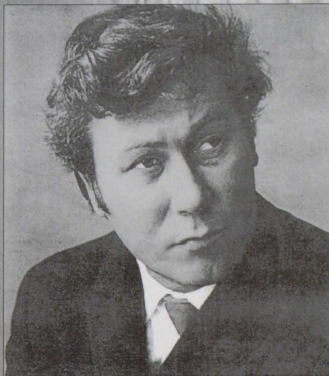
JOHN OSBORNE (1929-1994)

TEATRU Și-a început cariera de dramaturg în anii '50 pe vremea când era actor. A devenit celebru în 1956, odată cu montarea piesei sale Look Back in Anger / Privește înapoi cu mânie la teatrul de avangardă Royal Court Theatre din Londra. Debutul lui a marcat nașterea grupului intelectual al „Tinerilor furioși” ( The Angry Young Men / Tinerii furioși - „scriitori britanici de la sfârșitul anilor '50 ale căror opere sunt marcate de adâncă nemulțumire, frustrare și răzvrătire împotriva tradiției și societății.” cf. Webster's Encyclopedic Unabridged Dictionary , 1994).