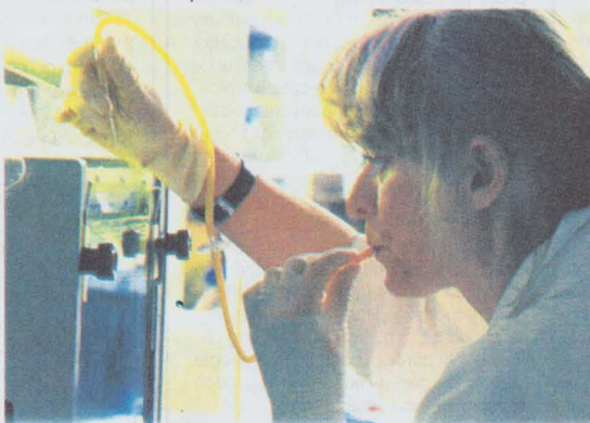
punctele de vedere.

Unele ritmuri provoacă nedumeriri: bunăoară, cele preconizate pentru ramuri care realizează produse cu valori adăugate mai mari. În legătură cu aceste nedumeriri ar fi bine să se pronunțe specialiștii din respectivele domenii, îndeosebi cercetătorii. "Univers ingineresc" le pune, cu plăcere, la dispoziție spațiul necesar pentru a-și expune