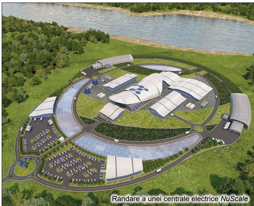
Randare a unei centrale electrice NuScale

„Sunt foarte încântată că acum începem o nouă eră, îmbunătățind infrastructura energiei nucleare a României cu un simulator SMR NuScale Power la Universitatea Politehnica din București, pentru a sprijini dezvoltarea educației și a forței de muncă, în baza Programului FIRST. România este foarte implicată în dezvoltarea primului reactor SMR în regiune și faptul că folosește ca punct de plecare competențele științifice, ingineresti și tehnologice reprezintă o garanție că programul nostru nuclear bazat pe noi tehnologii va asigura experiența necesară pentru stabilirea celor mai înalte standarde de siguranță și securitate nucleară. Sper că acest lucru va încuraja generațiile tinere să se alăture dezvoltării SMR în România și în regiune. (...) Nu există un partener mai bun ca România în regiune“, a afirmat subsecretarul de stat pentru Controlul Armelor și Securitate Internațională al SUA, Bonnie Jenkins.