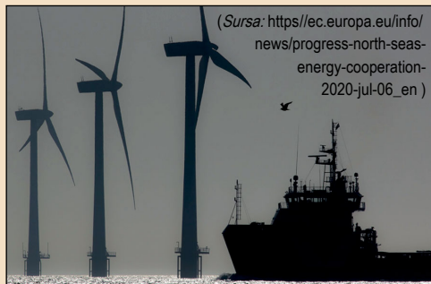
(Sursa: https://ec.europa.eu/info/news/progress-north-seas-energy-cooperation-2020-jul-06_en )

Marea Nordului ar putea deveni „centrala energetică verde a Europei” în trei decenii, grație impulsivității energiei eoliene offshore, conform unui angajament luat de Danemarca, Germania, Țările de Jos și Belgia. Șefii de Guvern din cele patru state au decis, la o reuniune pe teme de energie, să crească de zece ori capacitatea eoliană din Marea Nordului, la nivelul anului 2050, până la 150 GW. Angajamentul reprezintă un pas înainte în eforturile Uniunii Europene de a reduce dependența de combustibilii fosili, în special din Rusia, și de a impulsiona dezvoltarea energiei regenerabile, pentru o mai mare rezistență energetică, conform declarației semnate în localitatea daneză Esbjerg (vest).