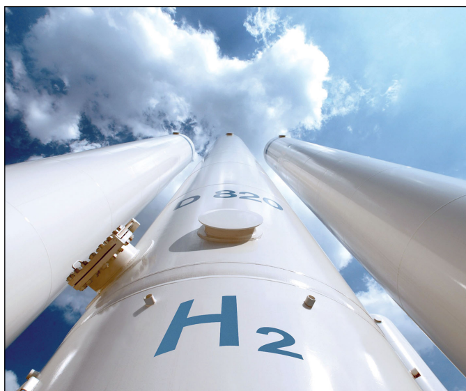
Regulamentului de instituire a Mecanismului de redresare și reziliență astfel încât, pe lângă numeroasele reforme și investiții relevante care sunt deja incluse în planurile de redresare și reziliență ale statelor membre, acestea din urmă să includă și capitole consacrate REPowerEU.

Transformarea verde va consolida creșterea economică, securitatea și acțiunile climatice în beneficiul Europei și al partenerilor UE. Mecanismul de redresare și reziliență (MRR) este un instrument central al Planului REPowerEU , sprijinind planificarea și finanțarea coordonată a infrastructurii transfrontaliere și naționale, precum și a proiectelor și reformelor din domeniul energetic. CE propune să aducă modificări punctuale Regulamentului de instituire a Mecanismului de redresare și reziliență astfel încât, pe lângă numeroasele reforme și investiții relevante care sunt deja incluse în planurile de redresare și reziliență ale statelor membre, acestea din urmă să includă și capitole consacrate REPowerEU . „Recomandările specifice fiecărei țări formulate în cadrul ciclului din 2022 al semestrului european vor contribui la acest proces”, subliniază CE.